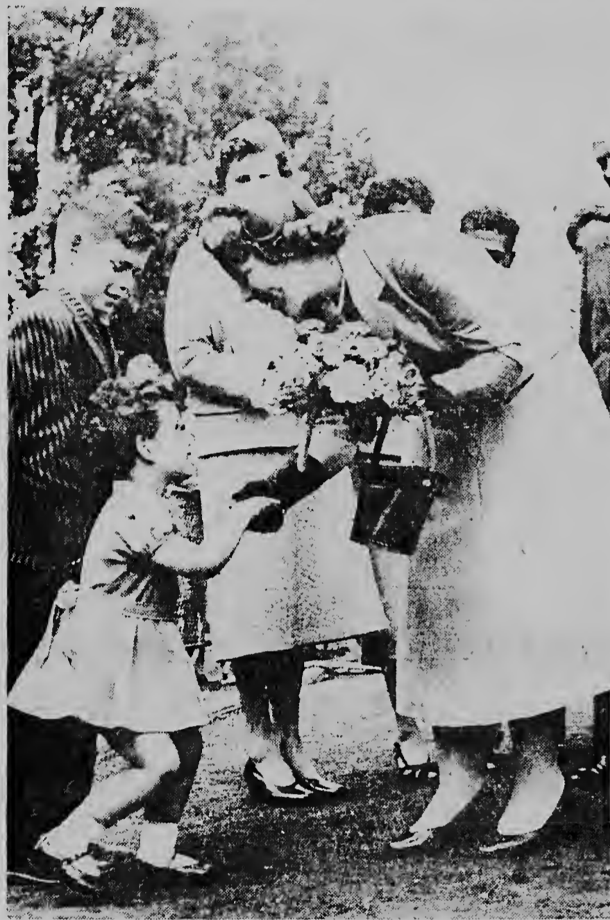
Prinses Beatrix durante su bishita na Amsterdam. Un mucha muher chiki ta bin ofrecere bouquet di flor. Esaki tambe ta un escena gracioso!